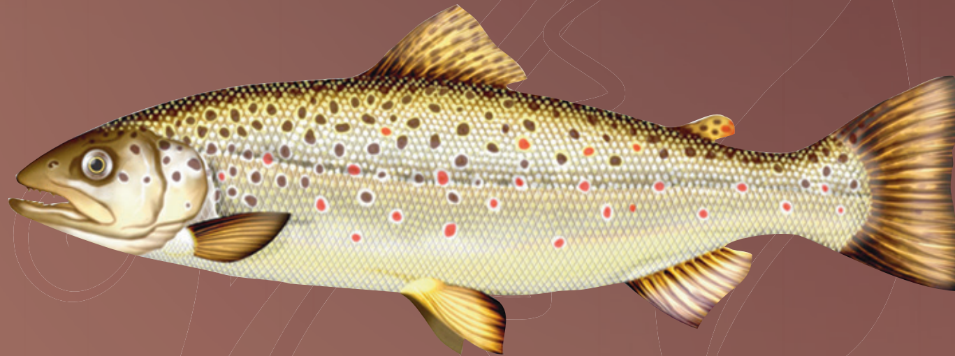
© Illustration de poisson / P.J. Dunbar

Le corps fusiforme et la silhouette élancée de la truite fario sont des caractères favorables à la nage rapide. Elle possède une grosse tête et une large bouche garnie de petites dents acérées. La nageoire caudale a un bord postérieur très peu échancré (presque droit) et la nageoire dorsale est réduite. La nageoire adipeuse de la truite fario se situe entre la nageoire dorsale et caudale (caractéristique de la famille des salmonidés). Les couleurs de sa robe varient en fonction des écotypes et des habitats.